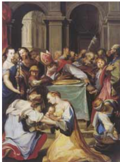
6. Joseph Heintz d. Ä., Beschneidung Jesu, um 1599 (Freiburg i.Br., Augustinermuseum)

An diesen wenigen Gegenüberstellungen zeigt sich schon, daß es einerseits gewisse formale Übereinstimmungen der früheren mit den späteren Werken, andererseits aber auch fundamentale Unterschiede zwischen ihnen gibt, die sich nun nicht ausschließlich als „veraltet“ oder „modern“ qualifizieren