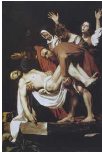
4. Michelangelo Merisi da Caravaggio, Grablegung Jesu , um 1602-1604 (Città del Vaticano, Pinacoteca)