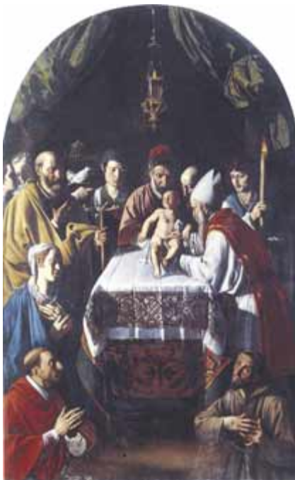
5. Tanzio da Varallo (Antonio D Enrico), Beschneidung Jesu, um 1630 ([CH], Fara San Martino)

den biblischen Personen eignet die gleiche Realität wie dem Stifterbild des Hl. Carlo Borromeo links unten. Ihre Gestik ist auf