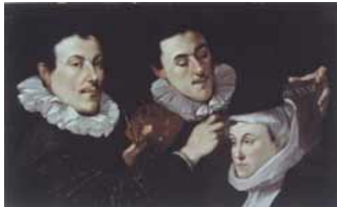
13. Joseph Heintz d. Ä., Selbstbildnis mit den Geschwistern, 1596 (Bern, Kunstmuseum)

für den Stich Gijsberts van Veen von 1589 verbindlich wurde, 52 bekäme im Lichte der hier vermuteten Zusammenhänge eine verblüffend einfache Erklärung: Annibale Carracci hat Heintz das Porträt des Florentiner Bildhauers