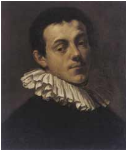
11. Hans von Aachen oder Annibale Carracci, Bildnis Joseph Heintz d.Ä., um 1584-88 (Prag, Národní galerie)

Barocci sind aber ebenso deutlich. Beide Bilder, so verschieden sie sein mögen, stellen sich vereinfachend gesagt - als Summe aus der italienischen Malerei seit Raffael dar und zeugen von einer verwandten Auffassung ihrer Malerei: Fernab vom „Realismus“ Caravaggios gehören sie in hoher ästhetischer Vollendung einer Gegenwelt an, indem sie jeweils die besten