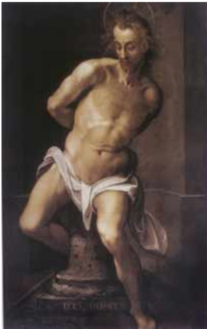
7. Joseph Heintz d. Ä., Jesus an der Geisselsäule , um 1595-1600 (Dresden, Gemäldegalerie Alte Meister)

Dies mag ein weiterer Vergleich verdeutlichen: Jesus an der Geisselsäule von Heintz (Abb. 7) 29 und die Geisselung Jesu von Caravaggio in Neapel (Abb. 8). 30 Das bisher wenig beachtete Gemälde von Heintz ist zeitlich nur schwer in sein Werk einzuordnen, vermutlich entstand es um 1595, dasjenige