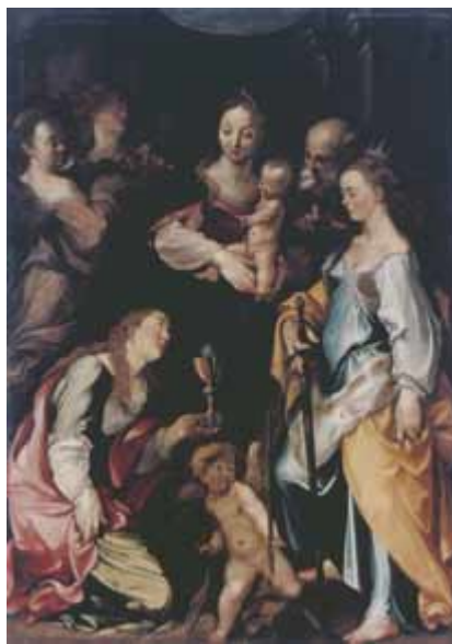
10. Joseph Heintz d. Ä., Sacra Conversazione , um 1600 (Prag, St. Thomas a.d. Kleinseite, Barbara-Kapelle)

Ludovicos Sacra Conversazione der Pala Bargellini von 1588 in der Pinakothek von Bologna (Abb. 9) 37 steht der Sacra Conversazione von Heintz, vermutlich aus den späten neunziger Jahren, in Prag, Barbara-Kapelle bei St. Thomas auf der Kleinseite gegenüber (Abb. 10). 38 In beiden Fällen handelt es sich um Altarblätter. Das Ludovicos steht der venezianischen Tradition nach Tizian