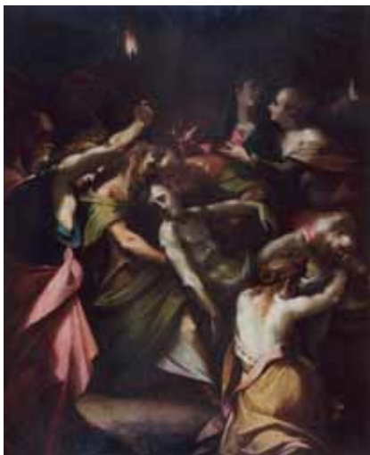
2. Joseph Heintz d. Ä., Grablegung Jesu , um 1593 (London, Privatbesitz)

Die Lichtquelle ist im Bilde, es ist die hochgehaltene Fackel in der weit in den Bildraum hineingestreckten Hand der an der linken Seite groß hervortretenden Person unbestimmbaren Geschlechts. Die Szene ist von links oben beleuchtet, alle Lichter und Schatten sind konsequent von dieser Lichtquelle bestimmt, sie definiert Nähe und Ferne, obwohl das von ihr ausgehende Licht kaum zur Erleuchtung der Szenerie ausreichen dürfte.