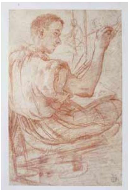
12. Annibale Carracci, Junger Zeichner bei der Arbeit, um 1587/88 (Berlin, Kupferstichkabinett SMB-PK)