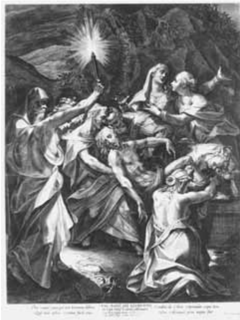
1. Aegidius Sadeler nach Joseph Heintz d. Ä., Grablegung Jesu, 1593

Es ist wohl wichtig, daß sich die Lichtquelle bei Caravaggio immer außerhalb des Bildes befindet. Es kommen aber andere Kriterien