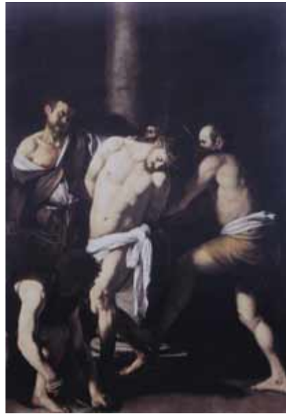
8. Michelangelo Merisi da Caravaggio, Geisselung Jesu , 1607 (Neapel, Museo di Capodimonte)

repräsentative Darstellung des letztlich siegreichen Christus ohne Züge einer Historie, im selben Sinne wie Giambognas Kleinbronze in Florenz, 31 die Geisselung Jesu Caravaggios