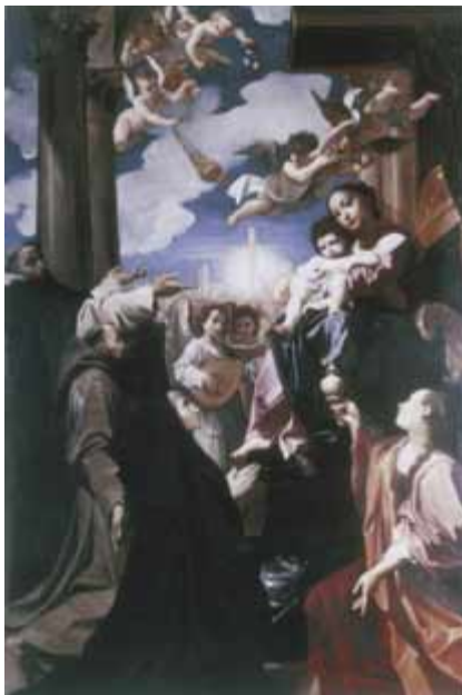
9. Ludovico Carracci, Sacra Conversazione (Pala Bargellini), 1588 (Bologna, Pinacoteca)

„Modern“ war auch die mehr „akademische“ Malerei der Carracci und ihrer bologneser „Schule“, ebenso wie jene Veroneses und Tintoretts. Die Sammlungsinteressen des