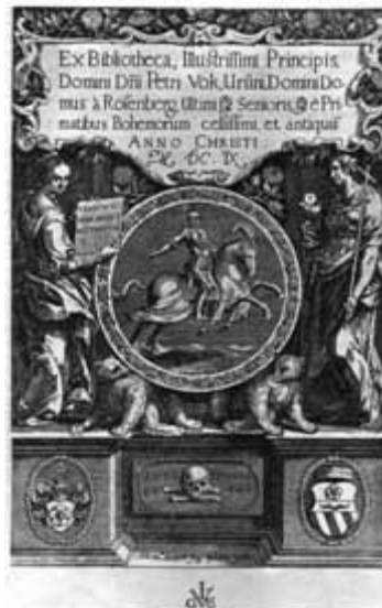
1. Aegidius Sadeler, Exlibris von Petr Wok von Rosenberg, 1609

Aufstellung der Bibliothek befand sich im korridorartigen Gebäude des Schlosses in Třeboň (Wittingau), wo der rosenbergsche Archivar, Prosopograph und Bibliothekar Václav Březan in den Jahren 1602 – 1608 einen ganz vorzüglichen Katalog der Büchersammlung verfasste. Die ausserordentliche Qualität des vierbändigen Kataloges besteht darin, dass die Einträge sehr akribisch sind,