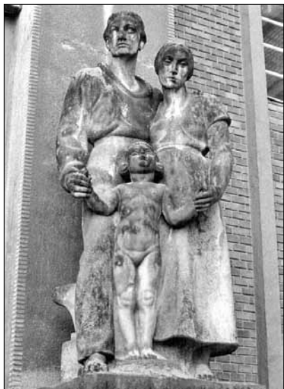
Olomouc, Náměstí Národních hrdinů čp. 2, bývalá Městská poliklinika, archi- tekt Jindřich Kumpošt. 1925–1927.

zajímá také po roce 1948. Jeho dělníci a rolníci jsou stále heroické postavy – těžce pracující muži a ženy, ale nejedná se o žádnou době poplatnou agitaci, stále je zde úcta k člověku a jeho dílu.