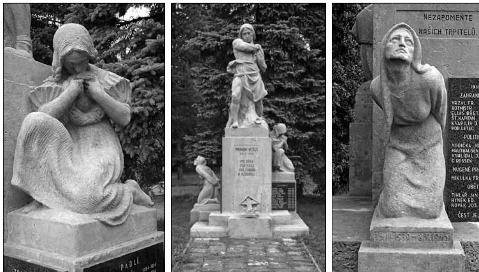
Pomník padlým I. a II. světové války, Senice na Hané, 1922 a 1948.

teriérové sochy Pelikán vytvořil vstupní reliéf s Ukřižováním. Novozákonní téma pojal jako alegorický výjev zasazený do současnosti. Kostel v Olomouci-Hejčíně byl postaven v letech 1928–1932. 14 Pelikán zde projevils mimořádný cit pro celkové propojení monumentální sochařské výzdoby od plastik Cyrila a Metoděje v nadživotní velikosti v exteriéru stavby až po nejmenší detaily liturgických předmětů v interiéru chrámu. Z církevních objektů je dále významná práce pro kostel Krista Krále v Ostravě-Svinově, kde je autorem oltářní sochy Krista a reliéfu na oltářní predelle a reliéfu Panny Marie Svatohostýnské a sv. Josefa. 15