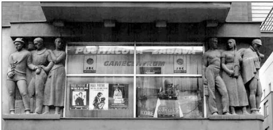
Ostrava, roh ulic Puchmajerova 5 – Zámecká 20, bývalá pojišťovna Riunione Adriatica di Sicurta, architekt Karel Kotas, 1927.

Velmi kvalitní jsou práce pro sakrální stavby, např. kapli sv. Cyrila a Metoděje v Příkazech a kostel sv. Cyrila a Metoděje v Olomouci-Hejčíně. Kaple je památník padlým v 1. světové válce navržený architektem Eduardem Göttlicherem z let 1924–1926. 13 Mimo in-