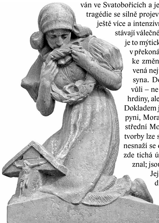
Pomník padlým I. světové války, Ostrava-Třebovice, ul. V Mešníku, 1922.