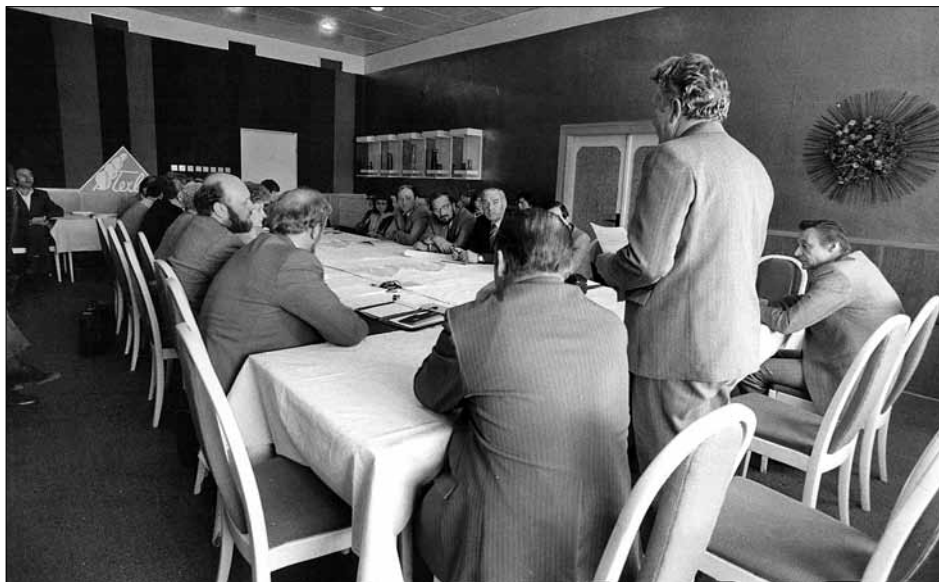
Šestý metodologický seminář historiků Inářství, Trutnov 28.4. 1984.