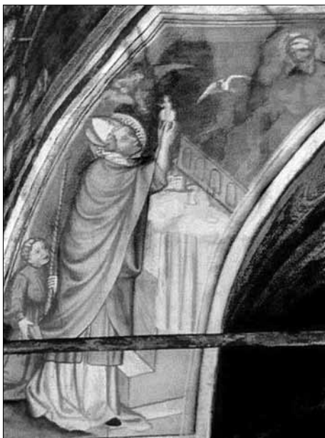
Mše sv. Martina, kol. 1403, nástěnná malba, St. Martin in Kampill, kostel sv. Martina.

Bohužel, za daného stavu se pravděpodobně nepodaří rozřešit otázku, proč se výjev zázračné mše sv. Martina objevuje právě v Přibyslavicích. Mnohé by v tomto směru mohlo