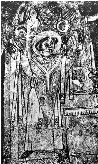
Mše sv. Martina , 30. léta 14. století, nástěnná malba, Grossbundenbach, kostel sv. Martina. Foto autor

Gia 12 a přibližně ve stejné době i na skandinávské výšivce s legendou sv. Martina, dnes přechovávané v pařížském Musée de Cluny. 13 V Itálii patří k nejznámějším příkladům této ikonografie nástěnná malba Simone Martiniho tvořící součást svatomartinského cyklu ve stejnojmenné kapli dolního kostela San Francesco v Assisi 14 a objevuje se i na freskách v katedrále v Piacenze či na polyptychu z Oratoria di S. Martino připisovaném Paolu Venezianovi. 15 V českém prostředí můžeme prozatím kromě přibyslavického výjevu uvažovat jen o jeho hypotetickém výskytu ve Křtěnově, 16 v rámci celé střední Evropy je nicméně zdokumentován například prostřednictvím nástěnných maleb z Leobenfeldu, 17 Grossbundenbachu, 18 St. Martin in Kampill, 19 Gnadenwaldu, 20 případně reliéfu z křídlového oltáře ze St. Martin in Göflan aj. 21