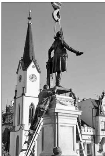
Usazování nové trutnovské sochy Josefa II. na podstavec v roce 2009