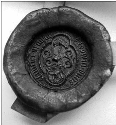
Pieczęć księcia śląskiego, pana Oławy i Niemczy, Ludwika III, przywieszona do dokumentu wystawionego wraz z bratem Ruprechtem w Legnicy 9 kwietnia 1424 r. Archiwum Państwowe we Wrocławiu, Rep. 2, nr 22.