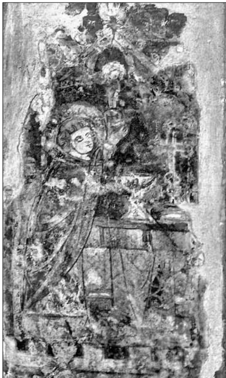
Mše sv. Martina (?), první třetina 14. století, nástěnná malba, Vídeň, kostel sv. Michala.