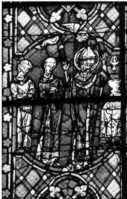
Mše sv. Martina, polovina 13. století, vitraj, katedrála v Tours.

Do výtvarného umění se výjev Martinovy zázračné mše dostává ve 13. století zejména prostřednictvím rozsáhlých narativních cyklů zdobících okna francouzských katedrál (vitraje z Tours, Bourges či Le Mans). 11 Současně lze jeho výskyt doložit i mimo Francii, v polovině 13. století se kupříkladu objevuje na antependiu z katalánského Sant Martí di