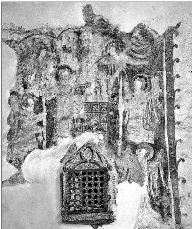
Mše sv. Martina , 50–60. léta 14. století, nástěnná malba, Přibyslavice, kostel sv. Anny.

středí neobvyklého. Klíčovou se pro výklad scény ukazuje především postava anděla v pravém horním rohu. Podrobnější průzkum poškozené malby odhalí, že se nad oltář snáší nikoli pouze s kadidelnicí, nýbrž i s částí jakési textilie, patrně kněžského roucha. Událost, jež by nejlépe odpovídala takovému popisu, nalezneme v legendě ze života sv. Martina. 6 Jistého dne měl tento světec – tehdy již biskup v Tours – na své pravidelné cestě do kostela potkat žebráka třesoucího se zimou. Nařídil proto arciděkanovi, který jej doprovázel, aby nuzáka oblékl; protože se k tomu ale neměl, věnoval sv. Martin žebrákovi svoji vlastní