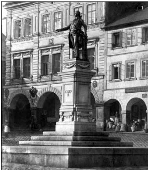
Socha Josefa II. na trutnovském náměstí počátkem 20. století

Přetvoření odkazu Josefa II. do podoby národního symbolu německy hovořícího obyvatelstva nabízí excelentní příklad kolektivní paměti jako etnicky konstruovaného diskurzu. Vznikly dvě národní kolektivní paměti – česká a německá – ve vzájemné opozici a paralelně vůči sobě. Němci překonali jiné, dřívější interpretace Josefa II. a uspěli v přetvoření Volkskaisera na císaře německého lidu ( Kaiser des deutschen Volkes ). Vždyť nápisy na všech Josefových pomnících jsou v němčině, a to i v etnicky smíšených regionech. 13 Sochy Josefa II. byly umístovány z velké části na náměstích nebo na jiných důležitých veřejných místech. Slavnostní odhalení manifestovala naději na posílení německého národního sebevědomí, sochy rovněž označovaly národnostně spornou půdu, obzvláště v severních Čechách, jako německou.