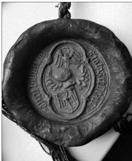
Pieczęć książąt śląskich, panów Lubina i Oławy (?), Jana I i Henryka X, synów Ludwika III i Małgorzaty, przywieszona do ich dokumentu wystawionego we Wrocławiu wraz z matką w przedziale lat 1441–1445, pomiędzy 9 marca a 11 kwietnia.