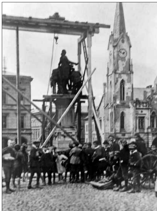
Demontáž sochy Josefa II. v Trutnově v roce 1923.