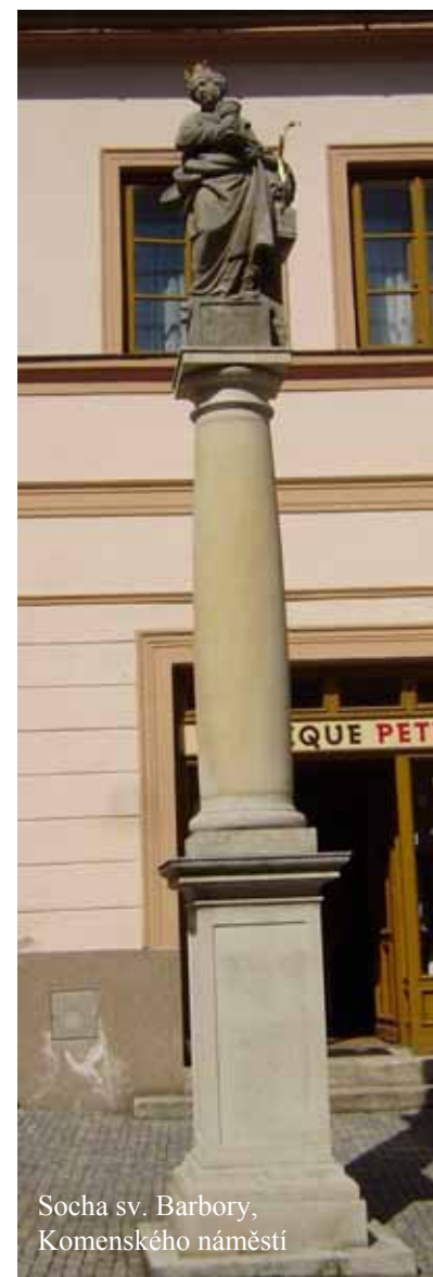
Socha sv. Barbory, Komenského náměstí

Attributes: Chalice and wafer, sword, cannon barrel