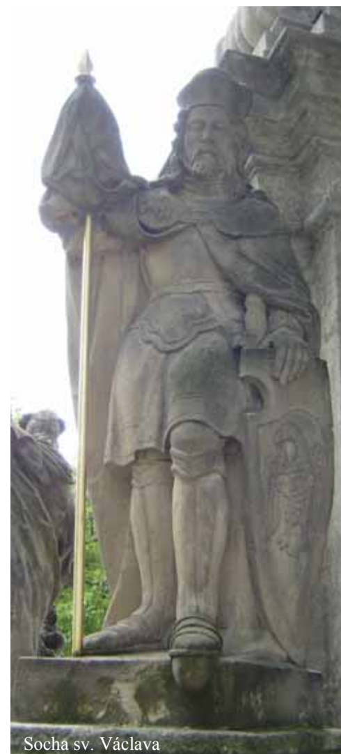
Socha sv. Václava

Attributes: Eagle, spear with a banner, insignia of prince