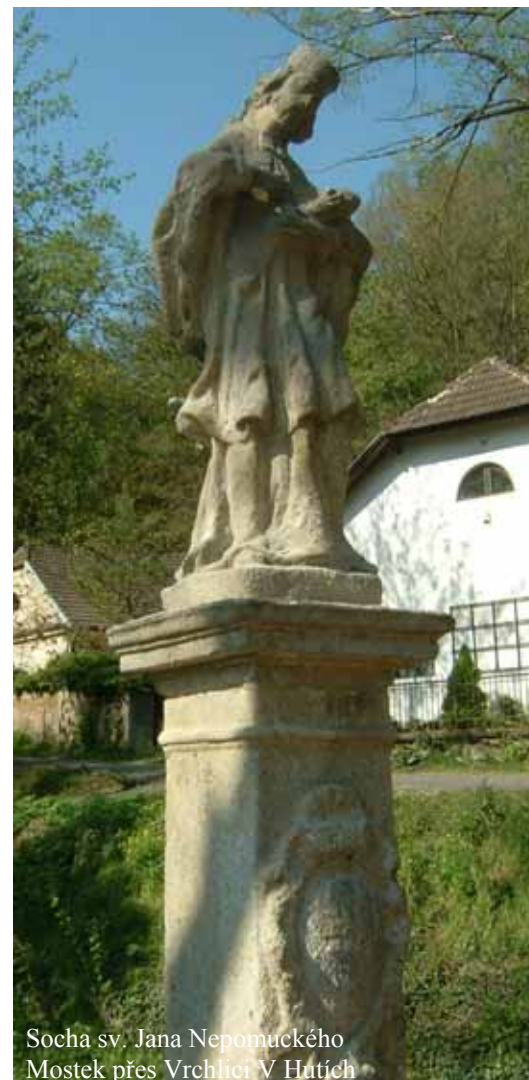
Socha sv. Jana Nepomuckého Mostek přes Vrchlici V Hutích

Attributes: Priestly dress, halo of five stars, the Cross, finger over the lips