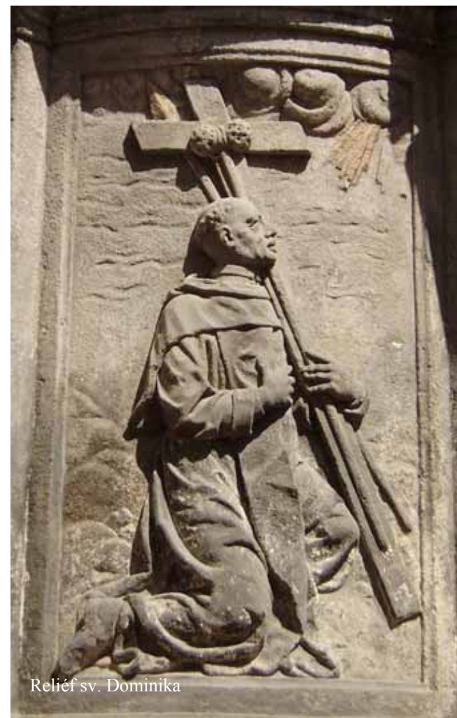
Reliéf sv. Dominika

Attributes: Priestly dress, the Cross, a spear, a cane