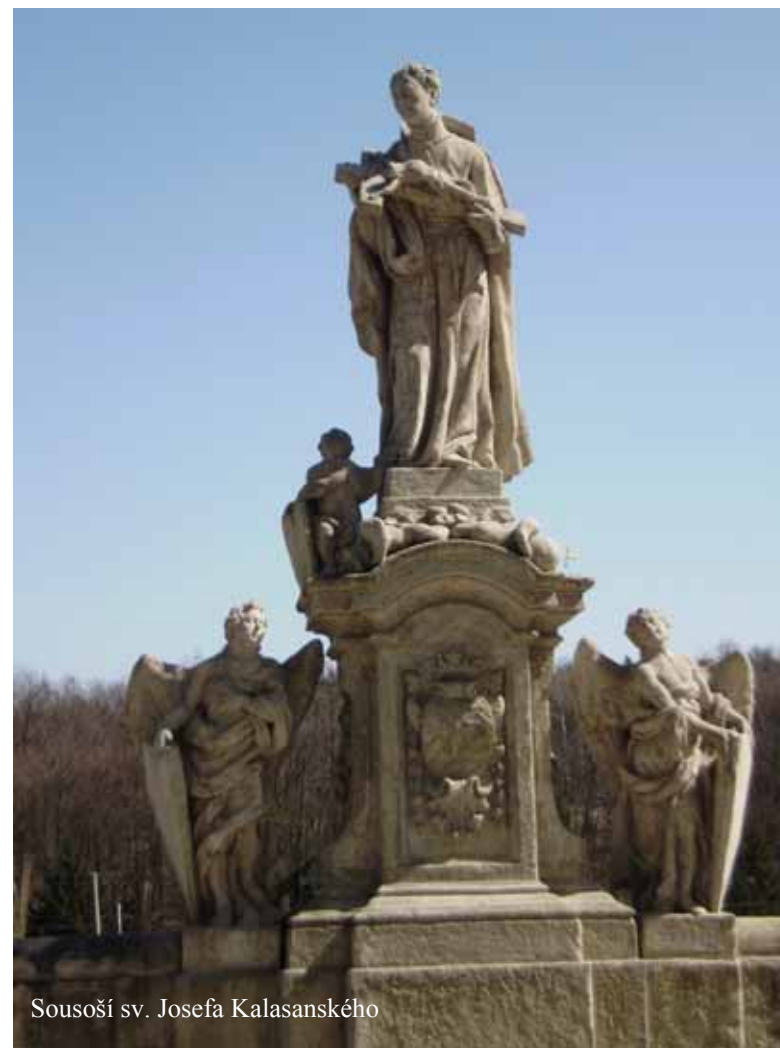
Sousoší sv. Josefa Kalasanského