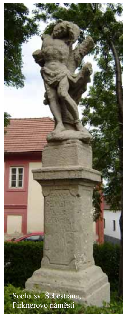
Socha sv. Šebestiána, Pirknerovo náměstí

Attributes: Shot by arrows, tied to a tree trunk