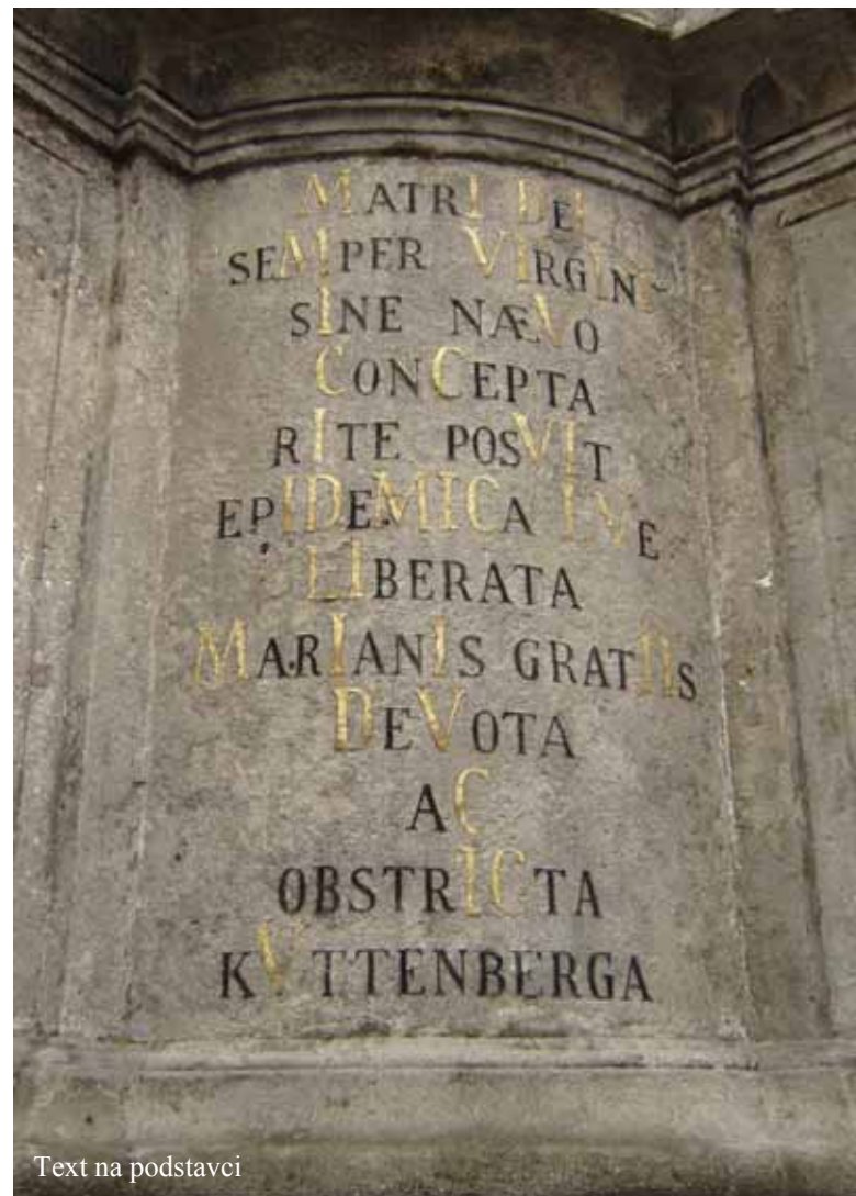
Text na podstavci

Matce Boží, vždy Panně bez poskvrny počaté postavila, když od morové rány milosti Mariánskou osvobozena jest zbožná a sklíčená Hora Kutná