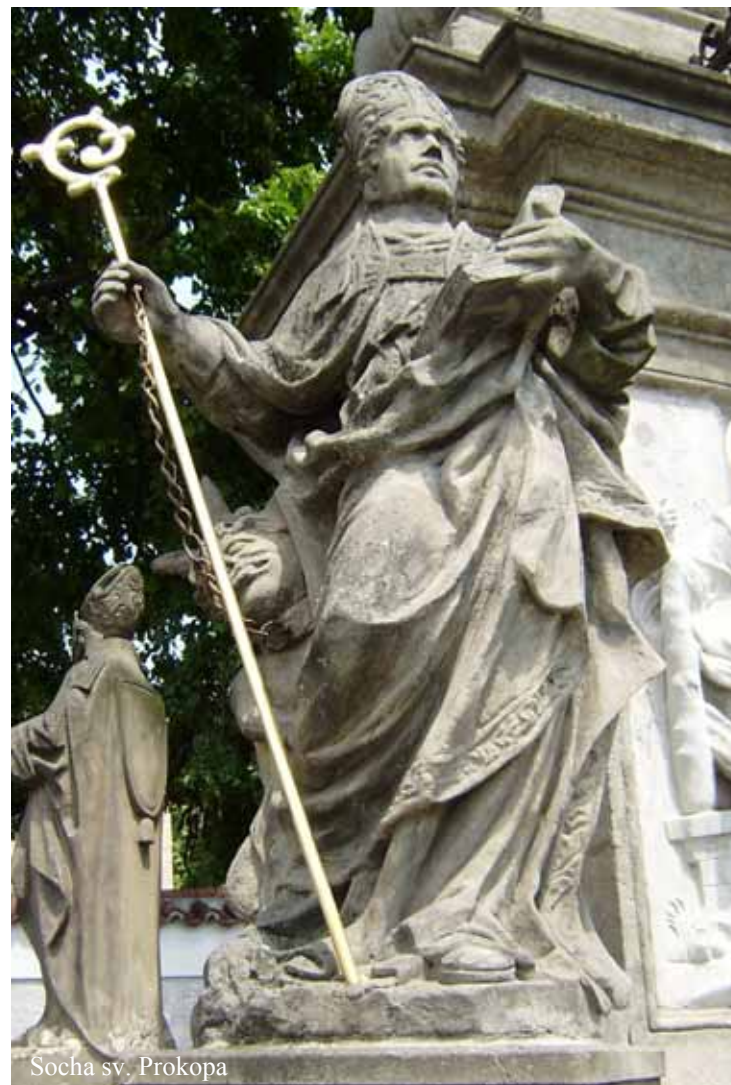
Socha sv. Prokopa

Attributes: Depicted as abbot, with chained devil, book, staff, mitre