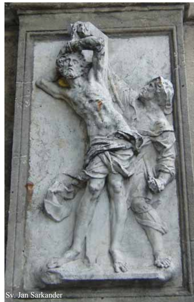
Sv. Jan Sarkander