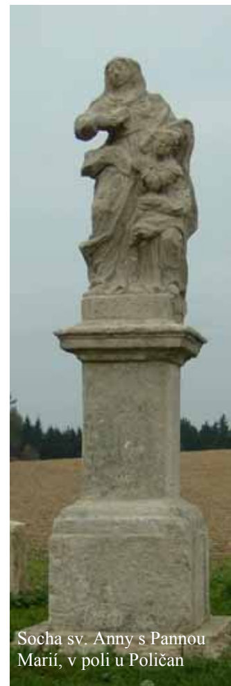
Socha sv. Anny s Pannou Marií, v poli u Poličan

Attributes: Small Virgin Mary, book, lily