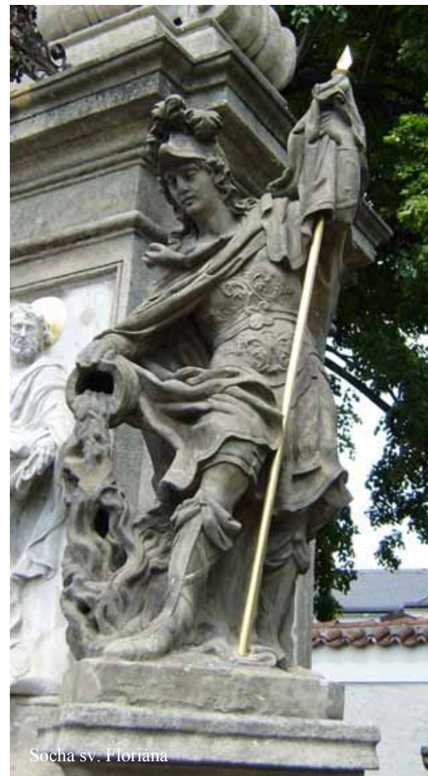
Socha sv. Floriána

Attributes: Roman soldier's dress, a pitcher of water