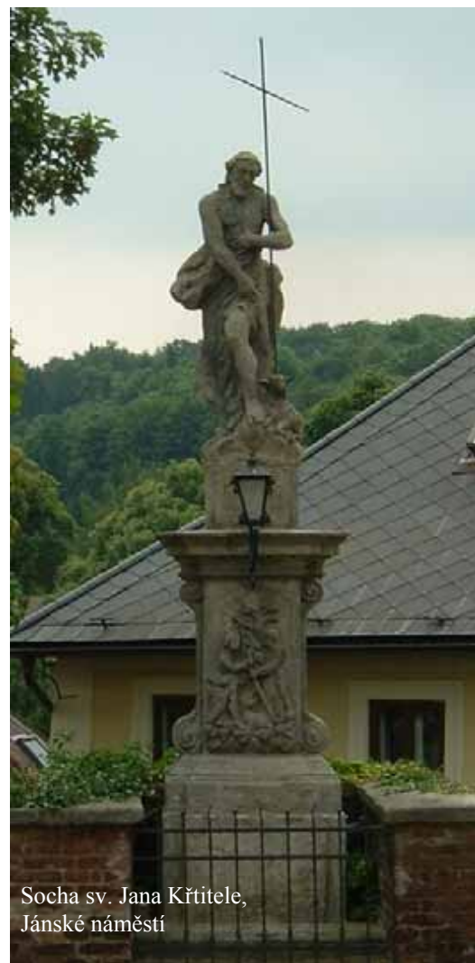
Socha sv. Jana Křtitele, Jánské náměstí