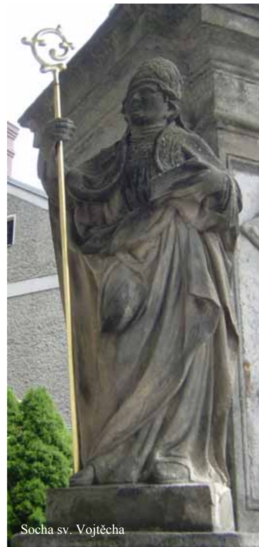
Socha sv. Vojtěcha

Attributes: Depicted as bishop, mitre, crosier, book