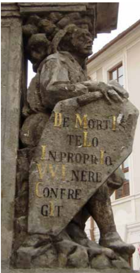
DE MORTIS TELO IN PROPRIO VVLNERE CONFEREGIT Od šípu smrti ve vlastním neduhu zachráněný Corn postavil 1714