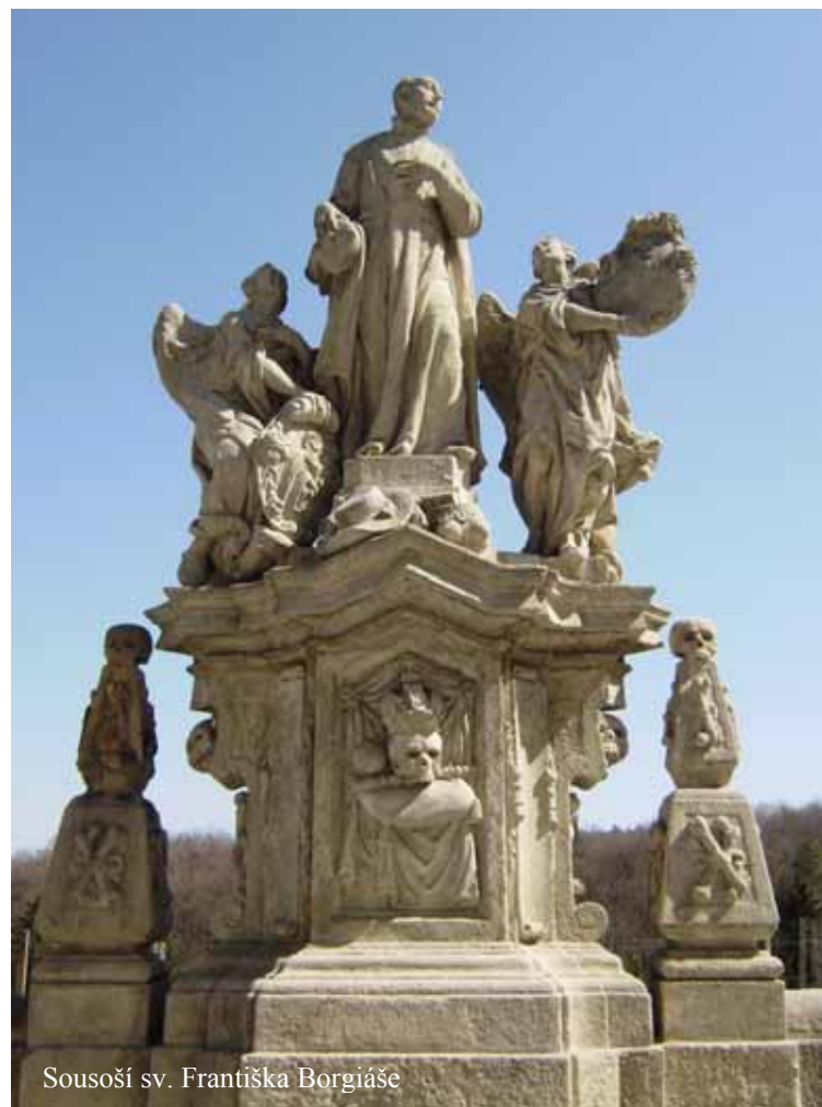
Sousoší sv. Františka Borgiaše

Attributes: Cardinal's hat, biretta, skull crowned with emperor's diadem