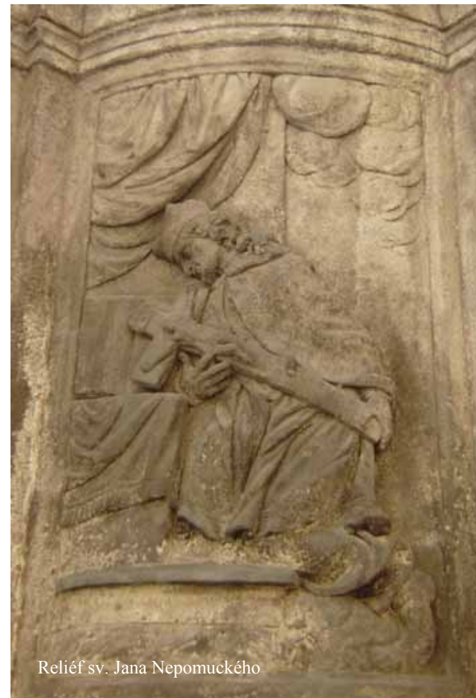
Reliéf sv. Jana Nepomuckého

Attributes: Priestly dress, halo of five stars, the Cross, finger over the lips