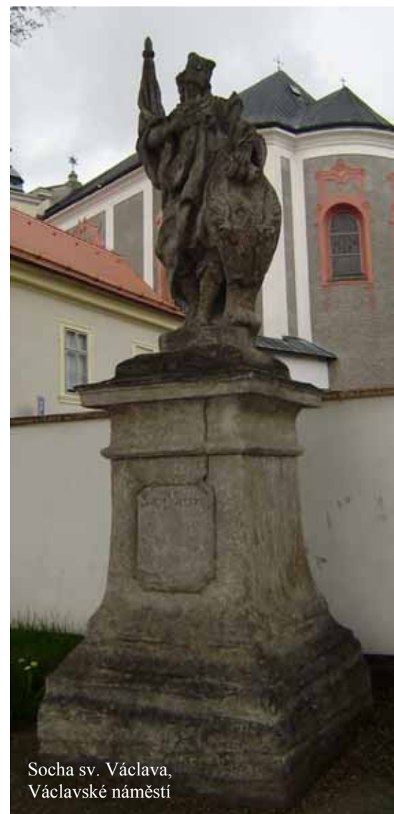
Socha sv. Václava, Václavské náměstí

Attributes: Eagle, spear with a banner, insignia of prince