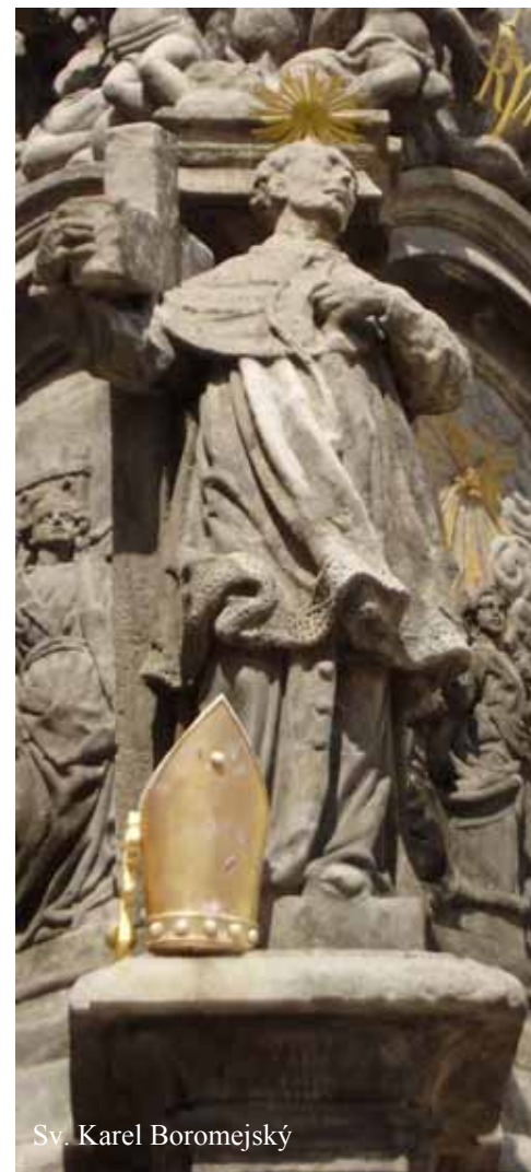
Sv. Karel Boromejský

Attributes: Mitre, bishop's robe, the Cross