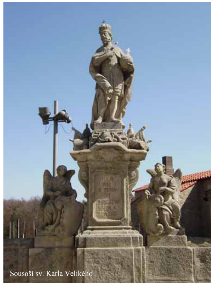
Sousoší sv. Karla Velikého

Attributes: Imperial insignia, Aachen Chapel