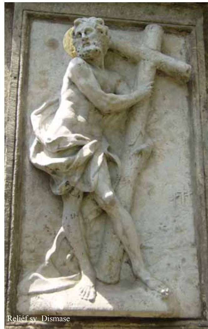
Reliéf sv. Dismase