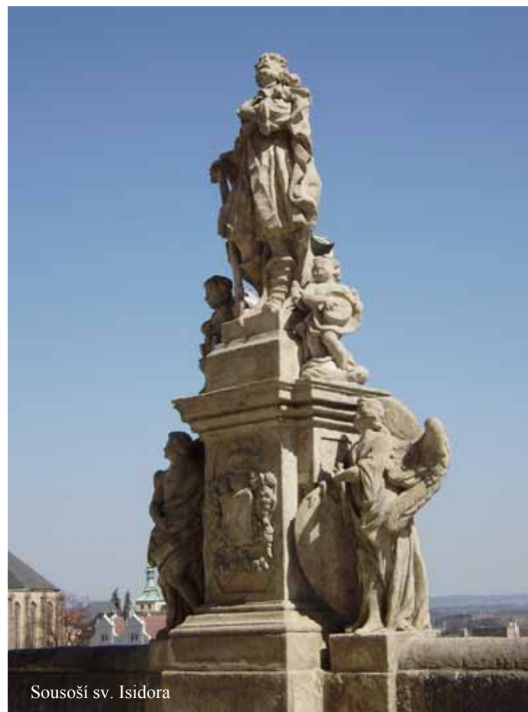
Sousoší sv. Isidora

Attributes: Spade, hoe, scythe, flail, plough