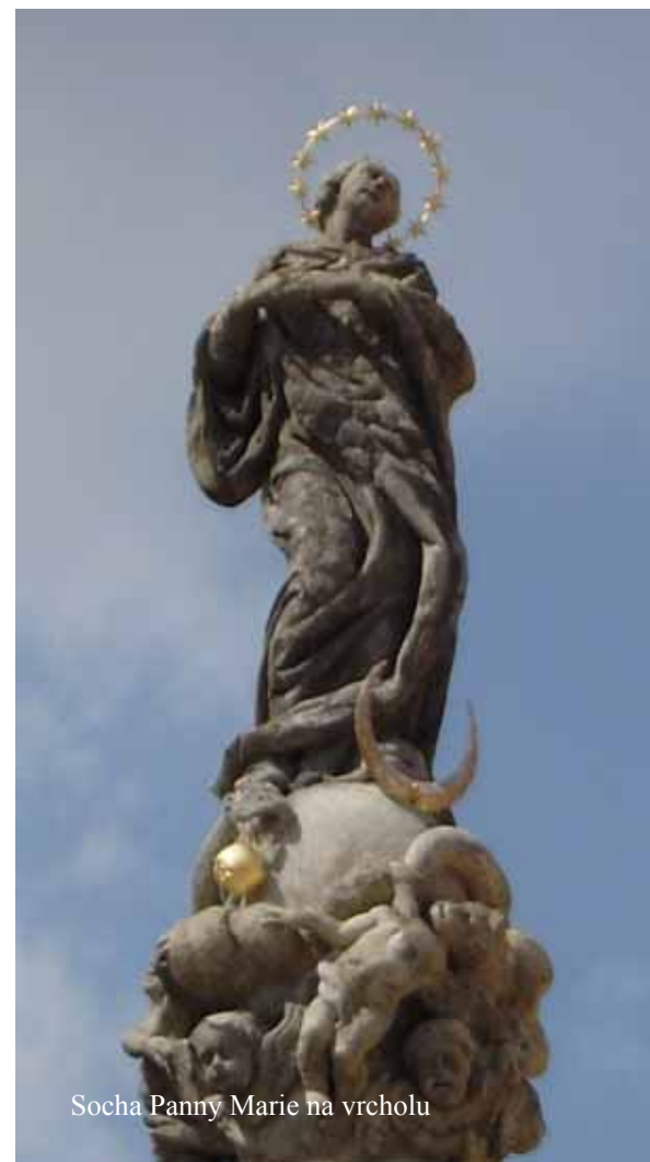
Socha Panny Marie na vrcholu

Attributes: The Globe, crown of 12 stars, the Moon