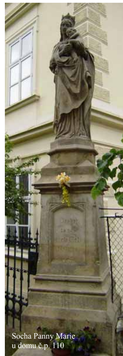
Socha Panny Marie u domu č.p. 110

Attributes: Baby Jesus, the Globe, crown of 12 stars, the Moon