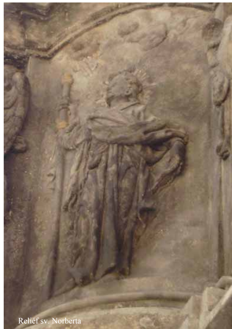
Reliéf sv. Norberta