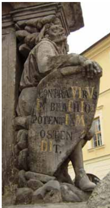
CONTRA VIRVS IN BRACHIO POTENTIAM OSTENDIT Proti jedu ukázala moc v pravici 1715