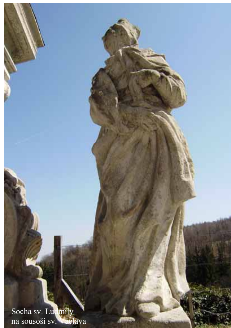
Socha sv. Ludmily na sousoší sv. Václava