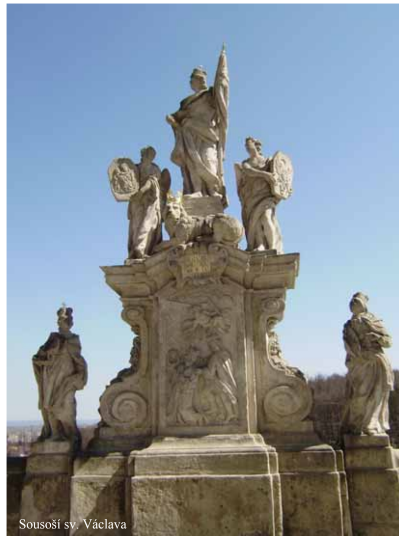
Sousoší sv. Václava

Attributes: Eagle, spear with a banner, insignia of prince