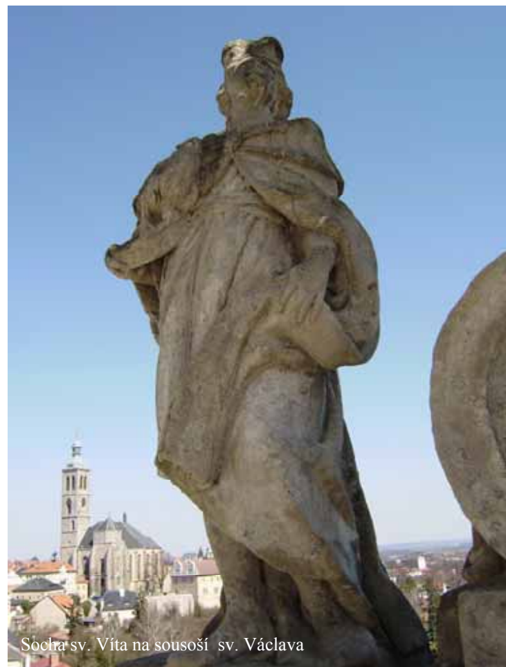
Socha sv. Víta na sousoší sv. Václava