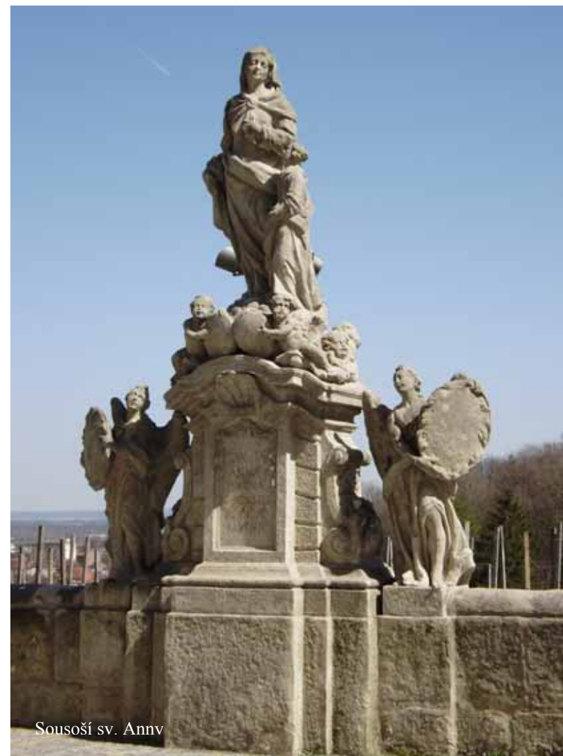
Sousoší sv. Anny

Attributes: Small Virgin Mary, book, lily