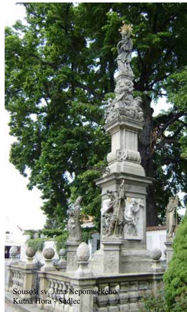
Sousoší sv. Jana Nepomuckého, Kutná Hora - Sedlec

Kolem ústředního podstavce s obeliskem stojí na podstavcích sochy světců: sv. Václava, sv. Floriána, sv. Prokopa a sv. Vojtěcha.