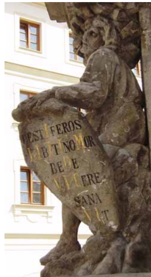
PESTIFEROS LIBITINO MORBE DE VLCERE SANA VIT Nakažených usmrcující nemocí od neduhu zhojila 1715