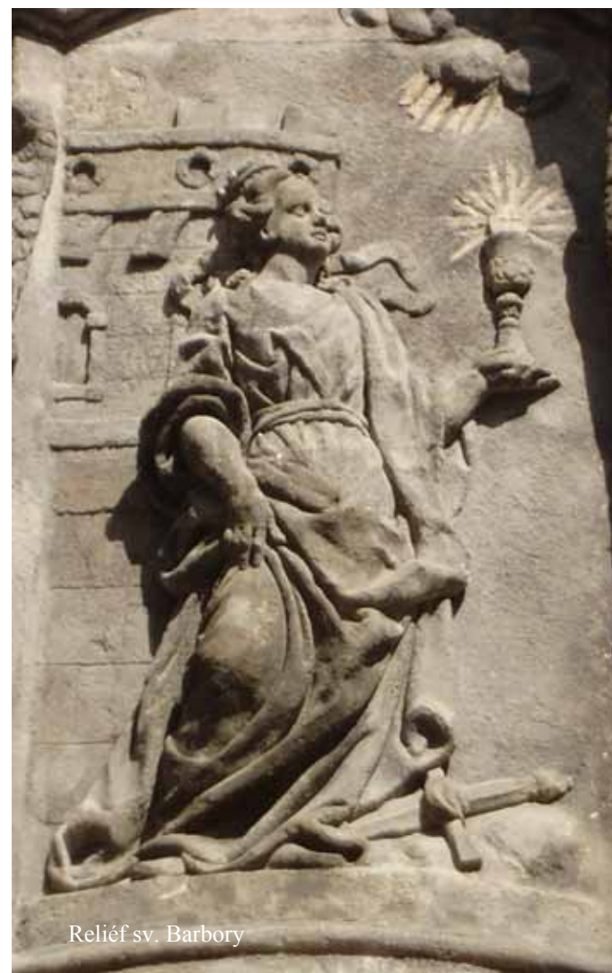
Reliéf sv. Barbory

Attributes: Chalice and wafer, sword, cannon barrel