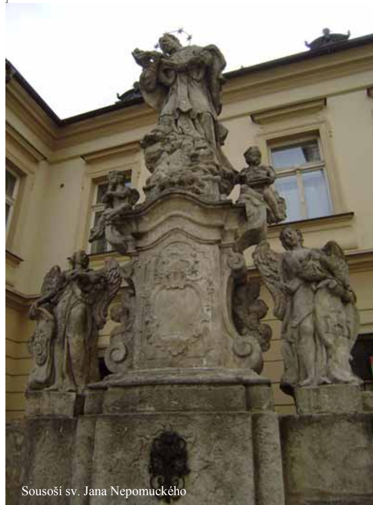
Sousoší sv. Jana Nepomuckého

Attributes: Priestly dress, halo of five stars, the Cross, finger over the lips