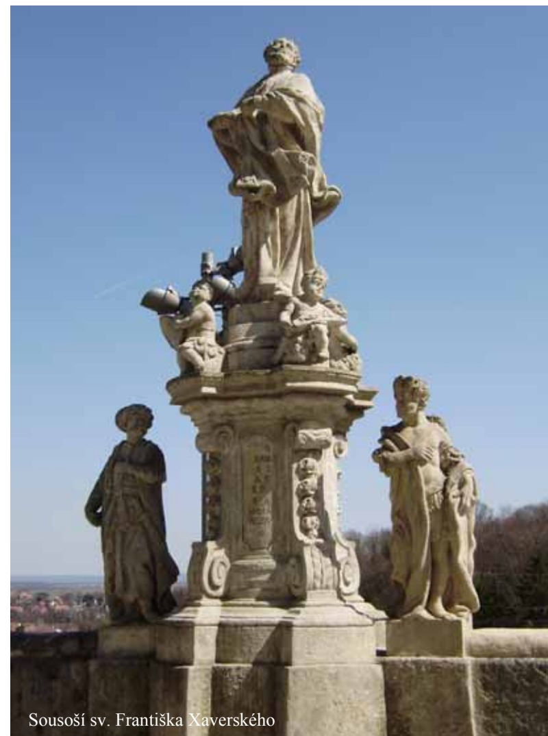
Sousoší sv. Františka Xaverského

Attributes: Priestly dress and an allegory of the Continents