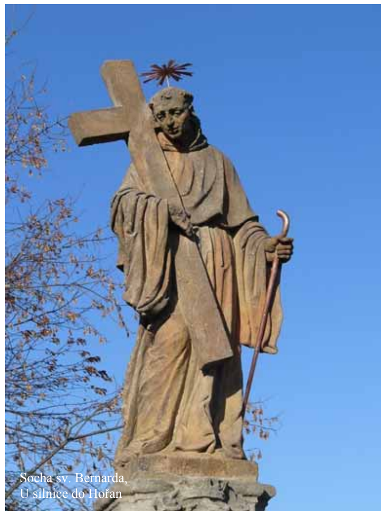
Socha sv. Bernarda, U silnice do Hořan

Attributes: Priestly dress, the Cross, cane