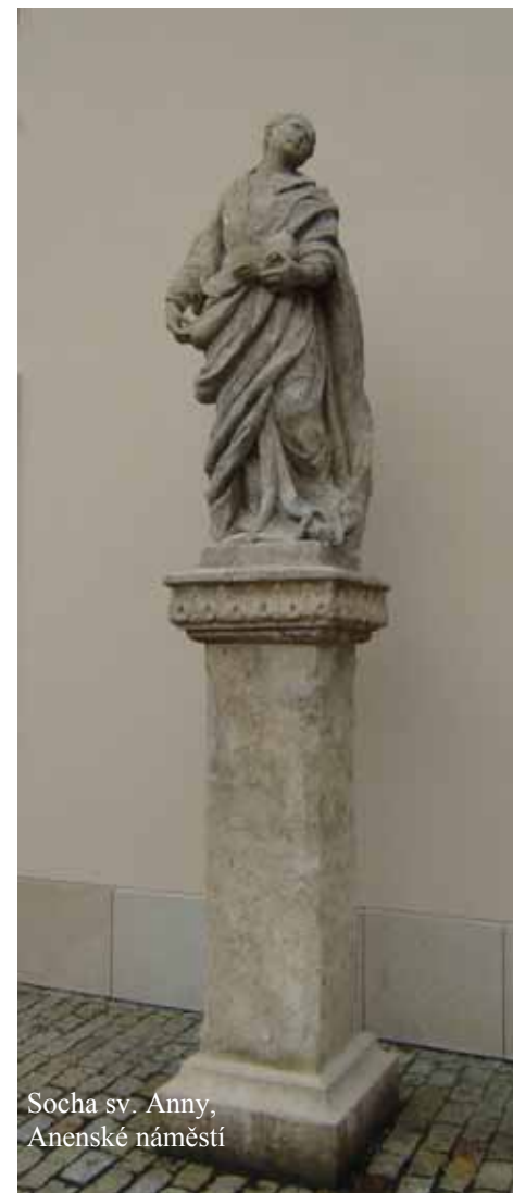
Socha sv. Anny, Anenské náměstí

Attributes: Small Virgin Mary, book, lily