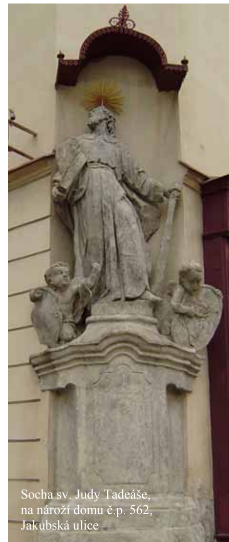
Socha sv. Judy Tadeáše, na nároží domu č.p. 562, Jakubská ulice

Attributes: Medallion with Christ's face, club