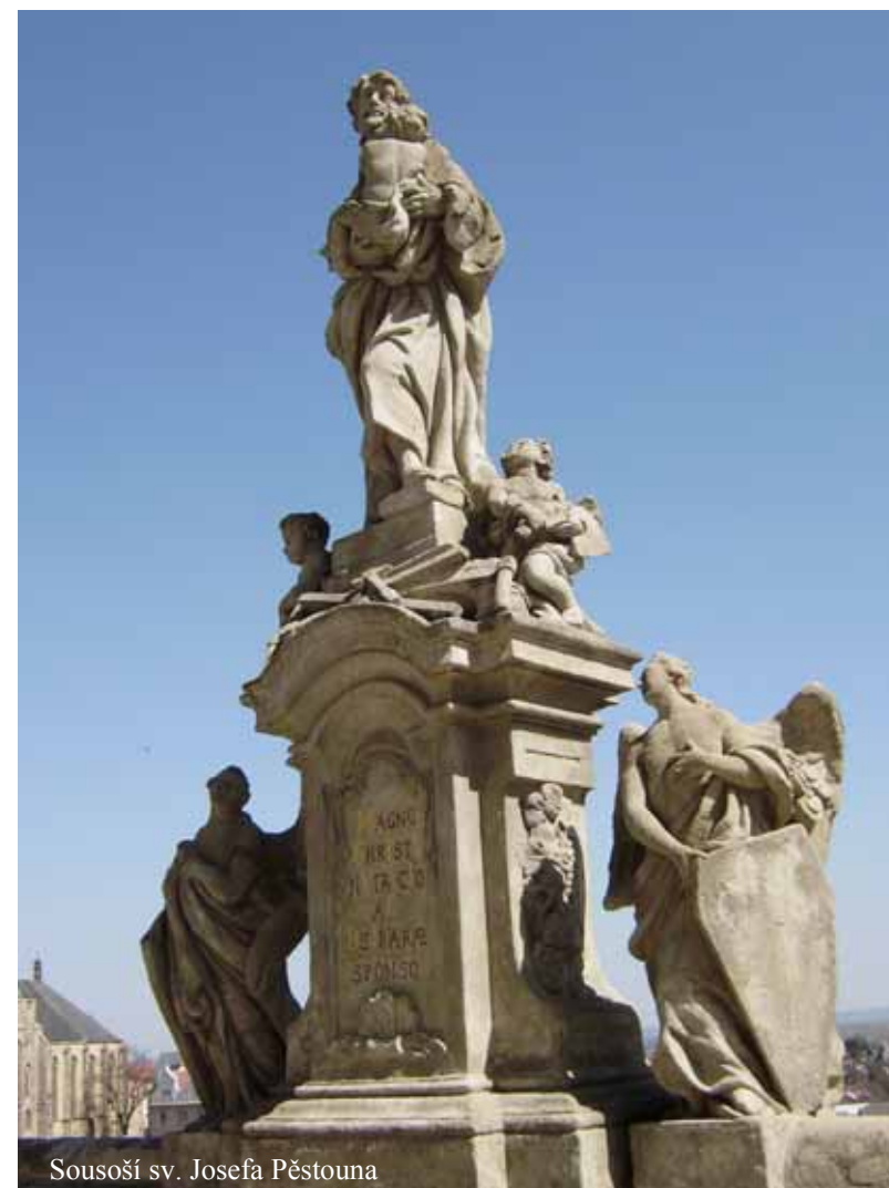
Sousoší sv. Josefa Pěstouna

Attributes: Carpenters' tools, infant Jesus