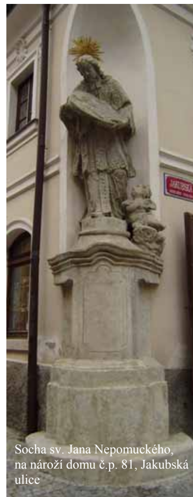
Socha sv. Jana Nepomuckého, na nároží domu č.p. 81, Jakubská ulice

Attributes: Priestly dress, halo of five stars, the Cross, finger over the lips