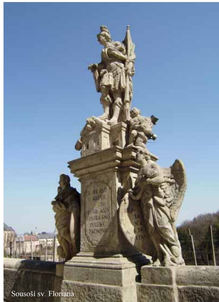
Sousoší sv. Floriana

Attributes: Roman soldier's dress, a pitcher of water