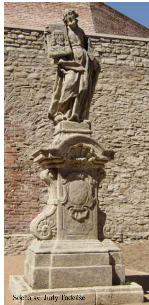
Socha sv. Judy Tadeáše

Attributes: Medallion with Christ's face, a halberd, a club, a stone; he can hold a book or a scroll of paper