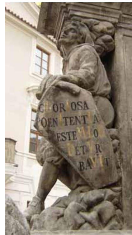
GLORIOSA POENITENTIA PESTEM LOCI DETVR BAVIT Vznešená kajícnost zahнала mor (tohoto) místa 1710