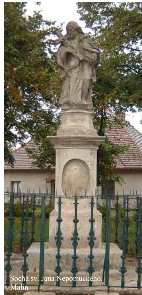
Socha sv. Jana Nepomuckého, Malín

Attributes: Priestly dress, halo of five stars, the Cross, finger over the lips