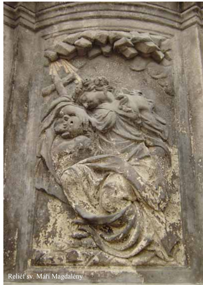
Reliéf sv. Máří Magdalény