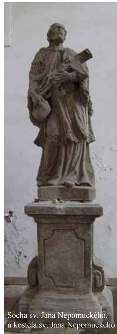
Socha sv. Jana Nepomuckého, u kostela sv. Jana Nepomuckého

Attributes: Priestly dress, halo of five stars, the Cross, finger over the lips