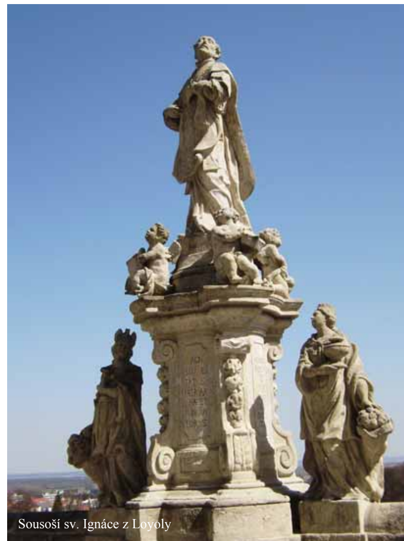
Sousoší sv. Ignáce z Loyoly

Attributes: Chasuble, biretta, heart with three nails, four Continents