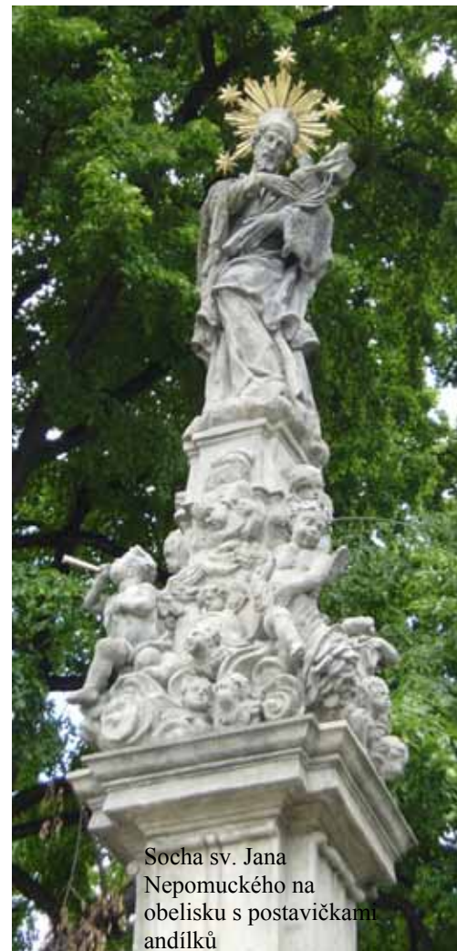
Socha sv. Jana Nepomuckého na obelisku s postavičkami andílků

Attributes: Priestly dress, halo of five stars, the Cross, finger over the lips