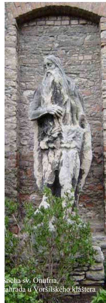
Socha sv. Onufria, zahrada u Voršilského kláštera

Attributes: Hermit, bread, loincloth, leaves, long hair