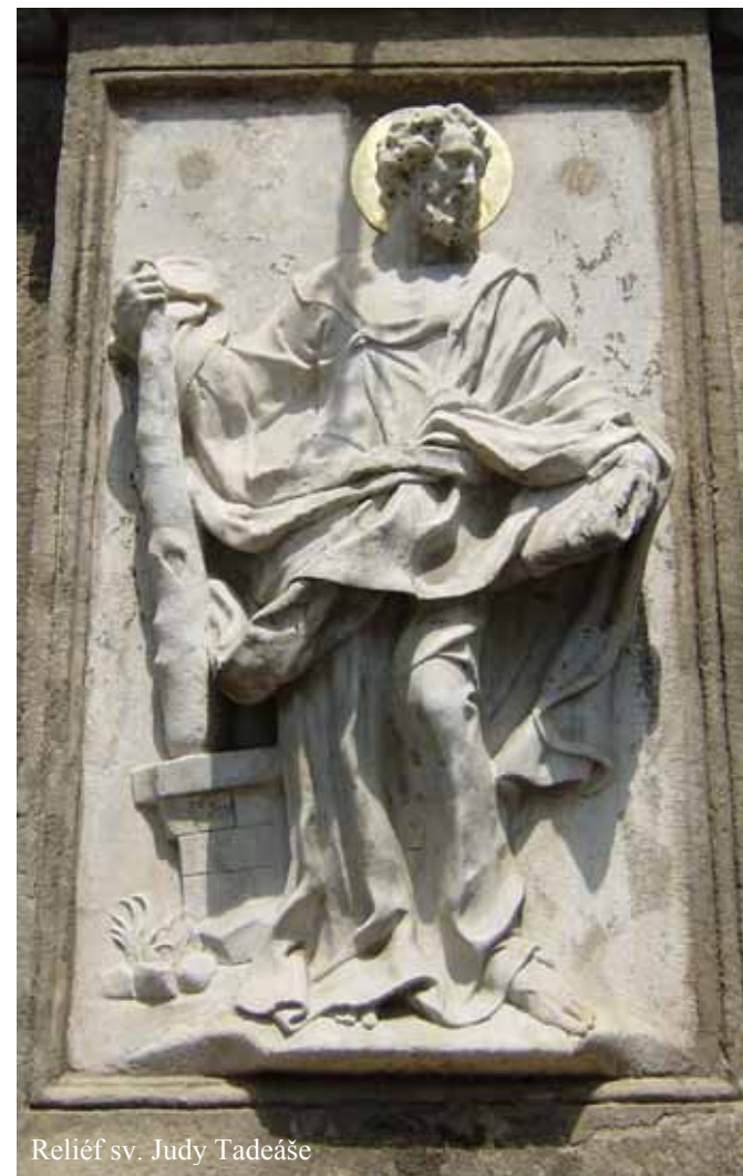
Reliéf sv. Judy Tadeáše

Attributes: Medallion with Christ's face, club