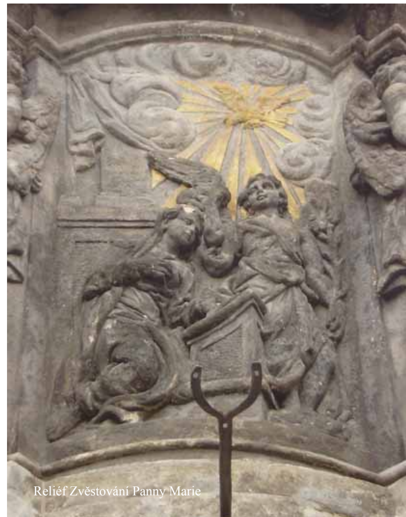
Reliéf Zvěstování Panny Marie

Apparition of the Archangel Gabriel, who announced to Mary that she will give birth to the Son of God.