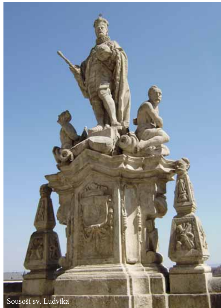
Sousoší sv. Ludvíka

Sv. Ferdinand III. Kastilský a sv. Ludvík Francouzský byli bratřenci.