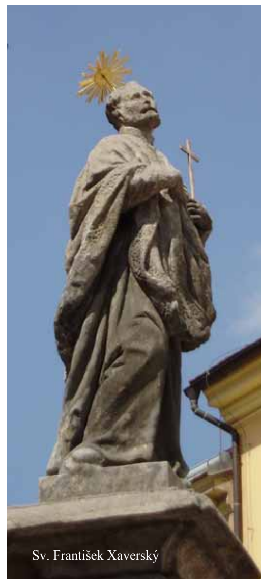
Sv. František Xaverský

Attributes: Priestly dress and an allegory of the Continents